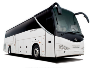
服务伦敦奥运车型 金龙欧洲之星XM6127