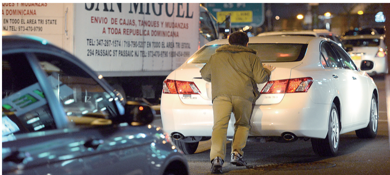
在美国纽约皇后区一座加油站前，一名男子推车前行等待加油。在飓风“桑迪”和暴风雪的接连影响下，美国受灾地区汽油供应系统恢复周期延缓。11月9日起，纽约市政府规定市内五区以及长岛地区车辆开始按照车牌号码分单双号加油。这是自上世纪70年代以来纽约首次大规模分号限购汽油。

分析人士认为，日本2012上半年度经常项目盈余跌至历年上半财年最小值，其原因是欧债危机引发的全球经济减速导致日本出口陷入低迷，直接打击了日本经济。上半财年出口总额方面，不仅面向经济衰退的欧洲，而且面向作为日本最大贸易对象的中国的出口也有所减少。对美出口虽然有所增长，但刚刚实现连任的美国总统奥巴马若无法解决 财政悬崖 问题，美国经济陷入停滞并重挫日本对美出口的局面将很难避免。