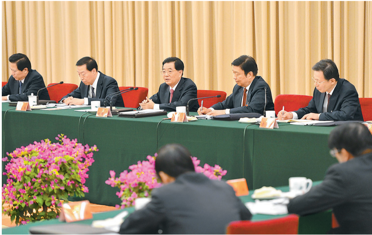
11月9日,胡锦涛同志参加党的十八大江苏代表团讨论。

胡锦涛表示,党的十六大以来,江苏同全国一样,经历了不平凡的10年。全省干部群众团结一心,开拓