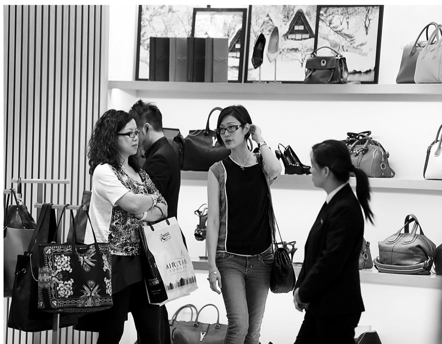
来自内地的游客在香港尖沙咀海港城购物。香港旅游发展局近日公布的统计数据 displays，今年前三季度，香港共接待内地游客2532.6万人次，同比上升24.2%，占同期来港游客总数的71.6%。

香港自2003年起向内地居民开放个人游，此后访港旅客人数一路上升。截至目前，已有内地22个省(区、市)的49个城市实施了内地居民赴港个人游政策，覆盖内地居民2.5亿人。2003年至2011年底，内地共有7852万人次的游客通过个人游方式到香港旅游，占内地赴港游客的53%。2011年两地双向交流人数达到1.08亿人次，成为全球流量最大的双向旅游客源市场。