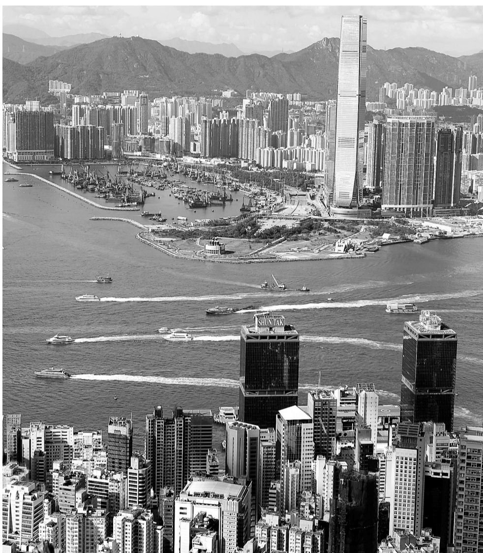
这是9月2日从太平山顶拍摄的港岛西区和西九龙的高楼大厦。香港特区政府近日宣布，将提高额外印花税的税阶，并将适用期延长至3年，同时推出全新的买家印花税，外地人士、所有本地和外地注册的公司购买香港住宅，需缴付15%的买家印花税。