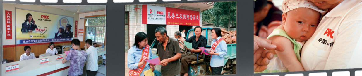
题图 中国人保位于北京西长安街的新大楼。 图 为农民送去交通安全保险。 图 把保险服务送到田间地头。 图 中国人保的志愿者照料汶川特大地震中的宝宝。