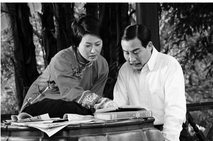
程获奖电视剧《我们的法兰西岁月》剧照

对这次评选，评委之一的白桦有着高度评价，我以为，因为评奖标准、评奖程序上的突出特点，获奖作品、获奖作者的鲜明特色等诸多因素，五个一工程奖已成为人文领域国家级最为重要的奖项。它在文艺图书方面的兼有虚构与纪实，以及整个奖项对象的多样性、综合性，它在强调思想性与艺术性的统一，专业化与大众化的并举上，都使其独一无二，无可替代。