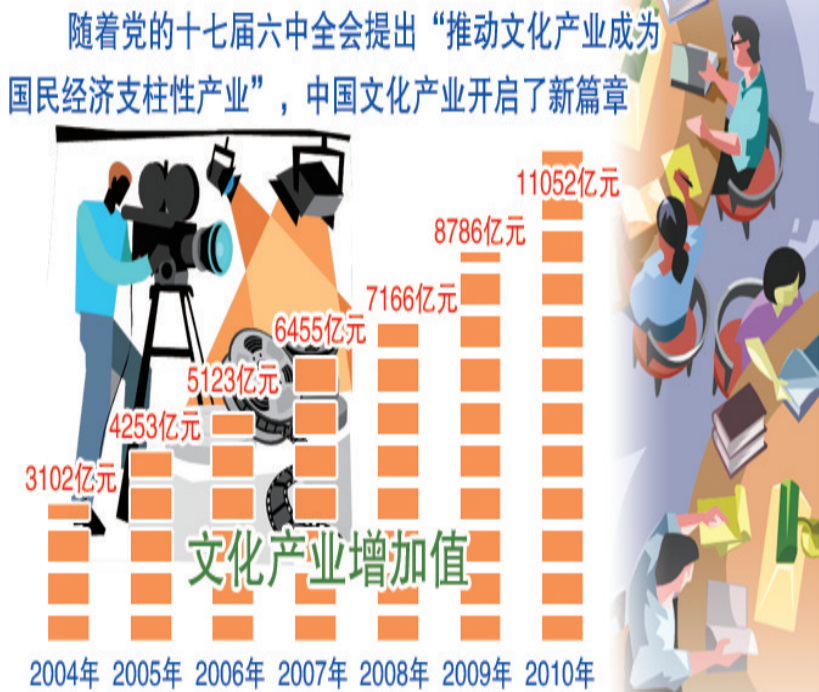
随着党的十七届六中全会提出“推动文化产业成为国民经济支柱性产业”, 中国文化产业开启了新篇章

9月24日,全三维动作喜剧动画片《熊出没》荣获“五个一工程”奖。以文化+科技为核心理念,华强集团推出的这部以环保为主题的喜剧,在春节特别节目登陆央视少儿频道时,首播创央视少儿春节同期播出动画片收视率第一,今年清明节、端午节、国庆节期间在央视多个频道多次重播,赢得国内观众的喜爱和权威机构的嘉奖,在国际上也屡有斩获,已进入全球知名的迪斯尼儿童频道,并在俄罗斯Karusel、伊朗IRIB等电视台热播。