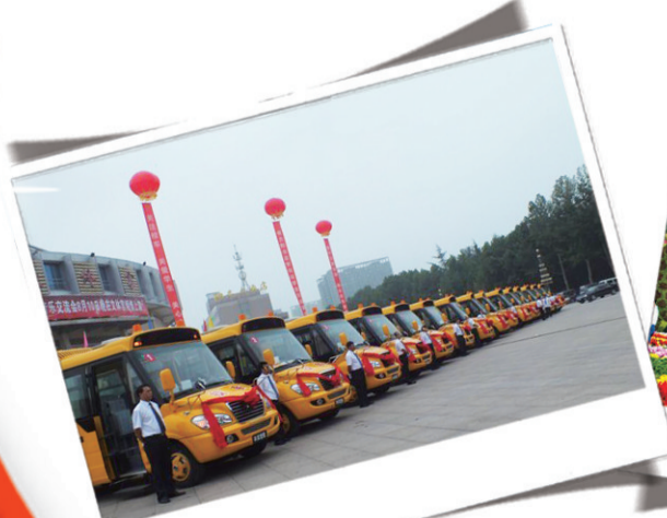
图 交付使用的校车。