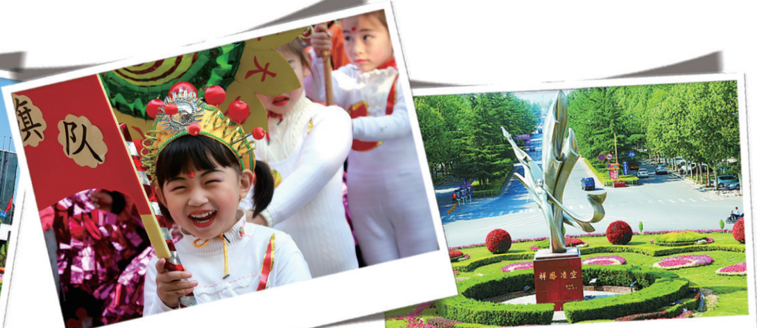
图 幼儿园的小朋友开运动会。