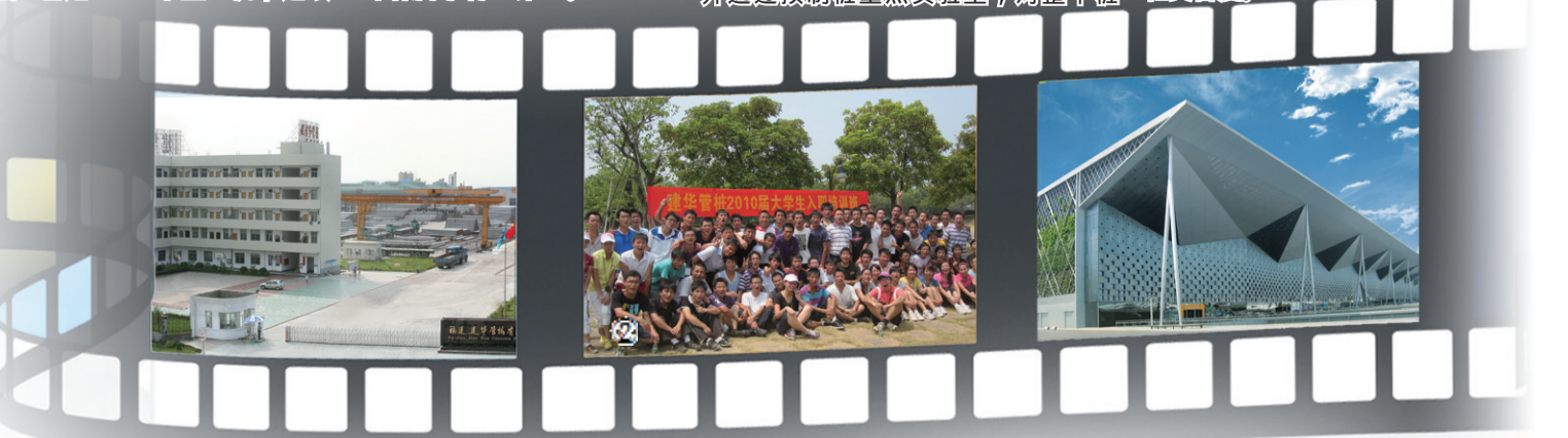
题图 建华管桩江苏基地俯瞰 图 10年来，建华管桩在国内17个省(区、市)建设了34个生产基地。 图 2004年成立的建华学院每年都会对新进大学生进行入职岗前培训。 图 上海世博会主题馆用上建华管桩的产品。