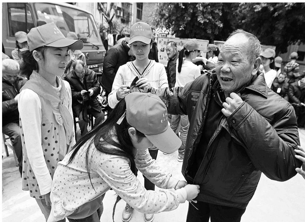
10月21日,重庆市江北区复盛镇敬老院来了20多位小红帽,来自当地小学的爱心志愿者们。小红帽让老人们提前过了一个温暖的重阳节。