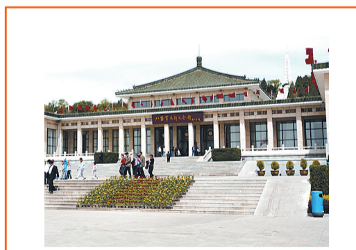
八路军太行纪念馆。

八路军太行纪念馆是中国唯一一座全面反映八路军8年抗战历史的大型专题纪念馆，也是集宣教、收藏、科研、旅游诸功能于一体的综合性红色旅游经典景区。