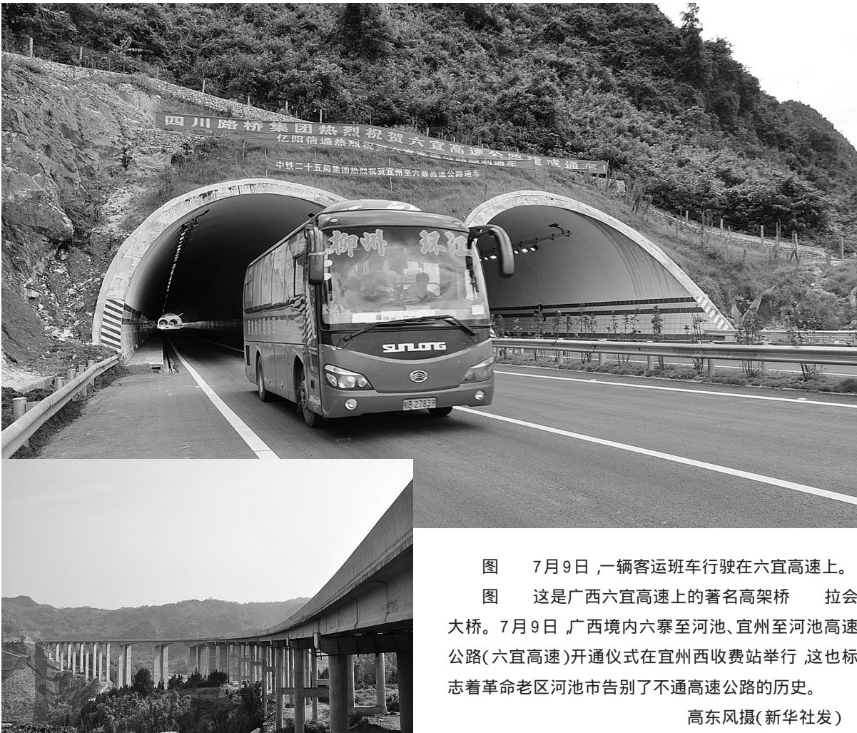
图 7月9日, 一辆客运班车行驶在六宜高速上。 图 这是广西六宜高速上的著名高架桥 拉会大桥。7月9日 广西境内六寨至河池、宜州至河池高速公路(六宜高速)开通仪式在宜州西收费站举行, 这也标志着革命老区河池市告别了不通高速公路的历史。

同时, 今年将进入保障房分配的高峰, 公平分配是 生命线 。几年来, 各地已探索形成了不少行之有效的好做法, 核心是规范程序、公正操作、公开透明、接受监督。住房和城乡建设部要求各地, 进一步严把准入关, 进一步实施实行阳光操作, 不断健全纠错机制, 防范和严查骗购骗租, 同时进一步完善退出制度。