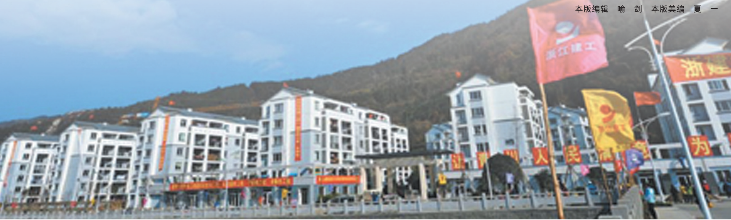
本版编辑 喻 剑 本版美编 夏 一