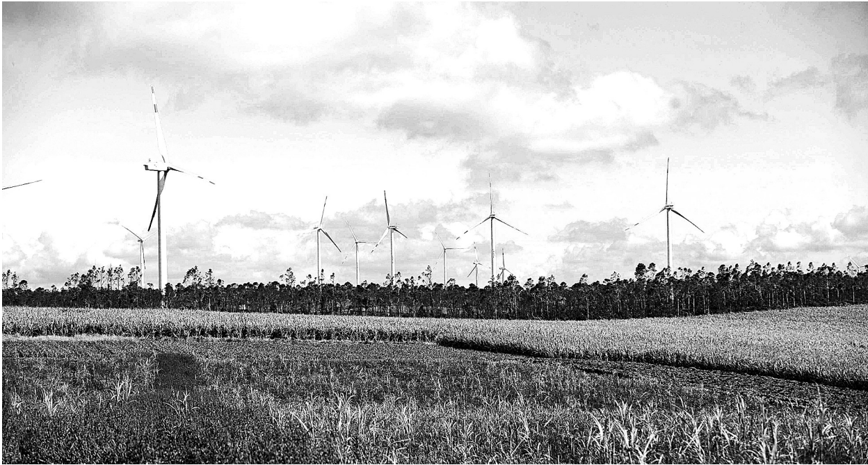
广东省徐闻县依靠资源优势，努力打造以风电、海洋潮汐发电为主的粤西最大清洁能源基地。该县规划的60万千瓦陆上和50万千瓦海上风力发电装机容量，已纳入广东省有关风电发展规划。这是徐闻县曲界镇风电场如画的田园美景。

在停复牌制度方面，新《上市规则》根据市场情况的变化，取消了实践中意义不大的3项例行停牌，分别是：股东大会召开日的全天停牌、异常波动公告披露日的一小时停牌和投资者沟通日全天停牌。