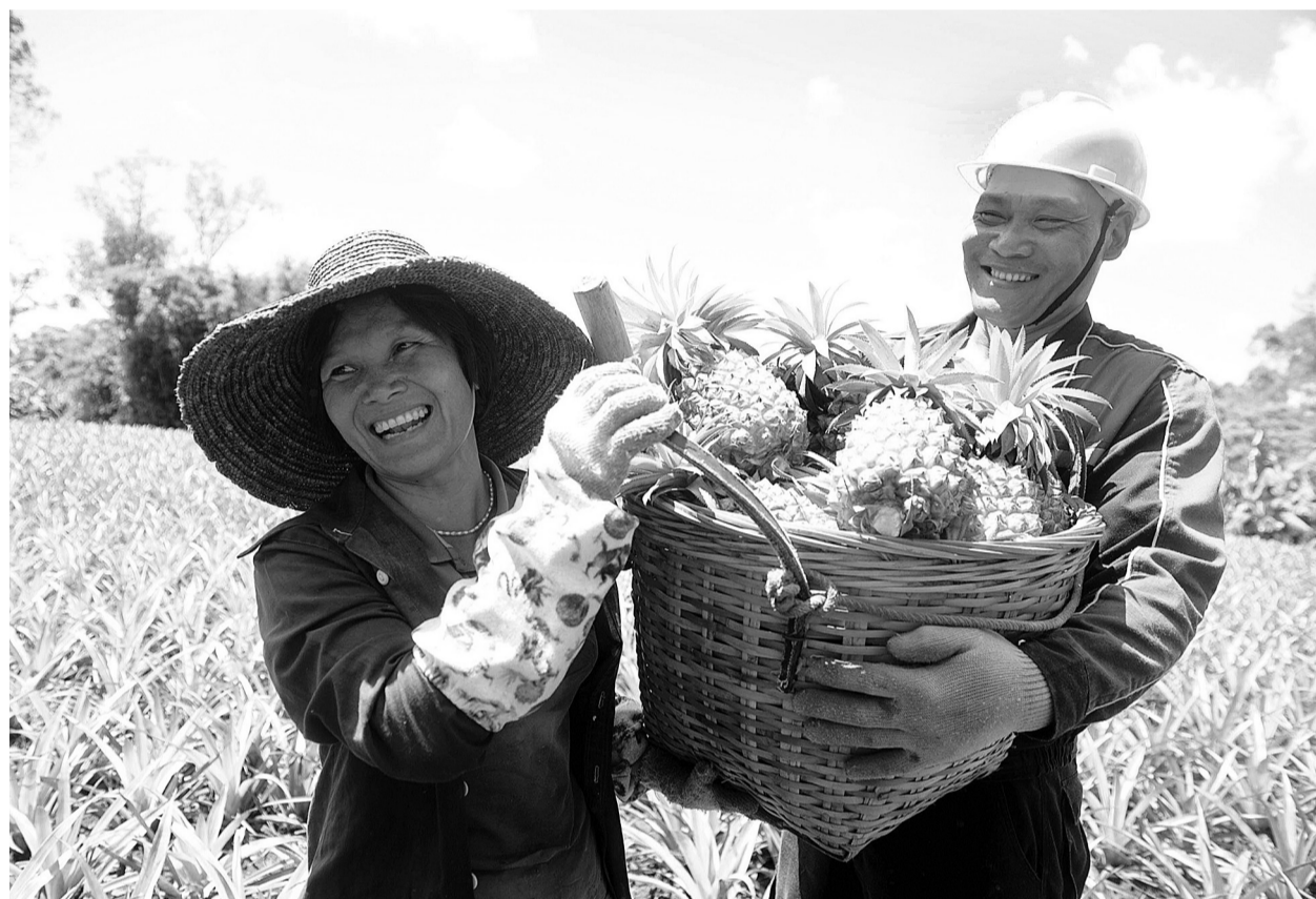
7月3日,广东省徐闻县曲界镇菠萝园,当地村民喜收菠萝。徐闻县凭借农业资源优势,加大特色农业发展力度,目前已建立热带农业示范区20个,形成菠萝、香蕉、芒果等10大商品基地。

本报北京7月3日讯 记者刘溟报道:中国进出口银行和新闻出版总署今天签署《关于扶持培育新闻出版业走出去重点企业、重点项目的合作协议》。根据协议,今后5年合作期内,中国进出口银行将为新闻出版企业提供不低于200亿元人民币或等值外汇的融资支持。中国进出口银行和新闻出版总署将发挥各自优势,大力推动新闻出版企业走出去,共同扶持培育新闻出版重点企业和重点项目,努力打造一批具有国际竞争力的新闻出版骨干企业和具有核心竞争力的知名出版传媒品牌,加快新闻出版版权、产品、服务、企业、资本走出去步伐。