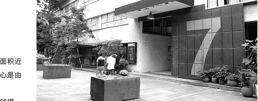
右图 浙江创意园内面积近2000平方米的第7号艺术中心是由民间资本投资兴建的。

2010年5月，国务院发布《关于鼓励和引导民间投资健康发展的若干意见》，鼓励民间投资参与铁路、市政、能源、电信、教育、医疗等领域建设。今年以来，已有20多个部门密集出台有针对性、可操作的实施细则，进一步明确民间投资进入相关领域的具体途径和方式。