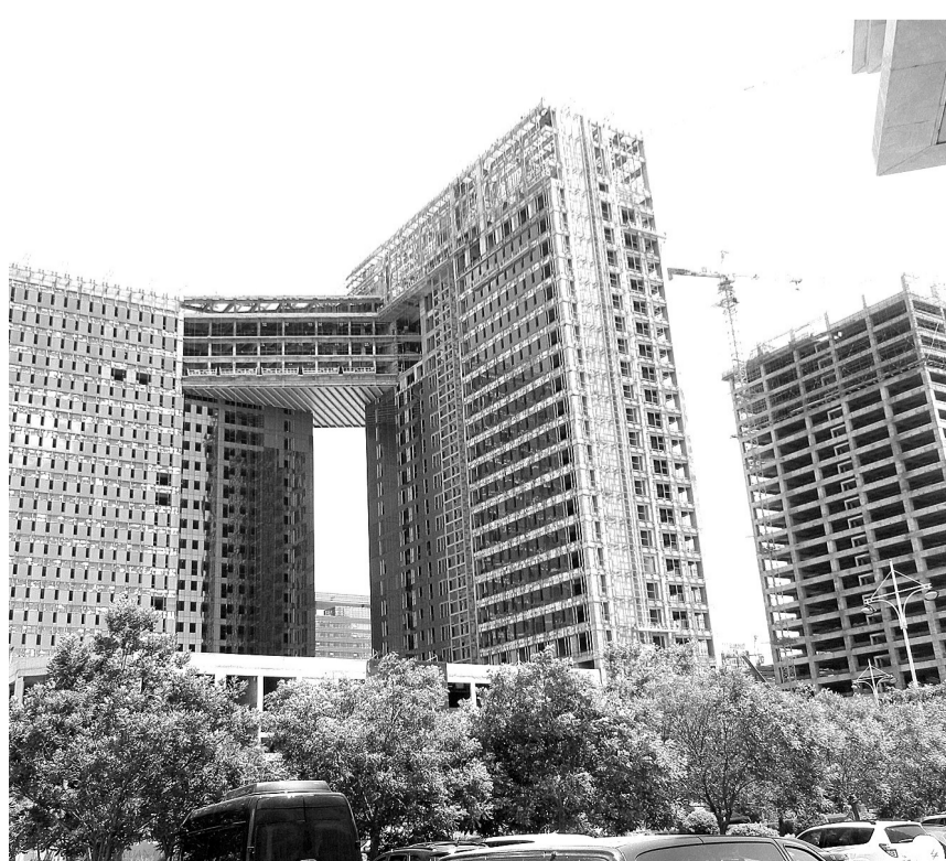
鄂尔多斯市不少楼盘由于资金紧张停止施工。

调研组成员 本报记者 吴昱 张玫 张毅 陈力 王信川 王晋 陆敏 喻剑 黄俊毅 杜铭 张忱 韩志