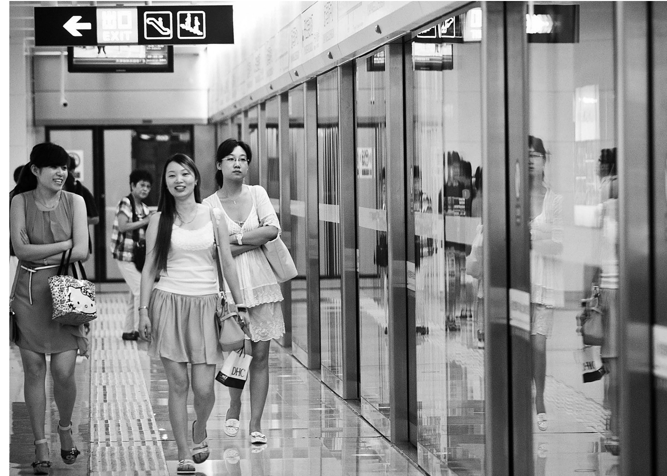
7月1日 ,市民在远洋国际中心站准备乘地铁。当日 ,天津地铁 2 号线开通试运营。地铁 2 号线是贯穿天津市东西的轨道交通干线 ,全长 22.7 公里 ,共设车站 19 座。本次开通采取东、西两段分段试运营组织模式 ,共开通 17 座车站。