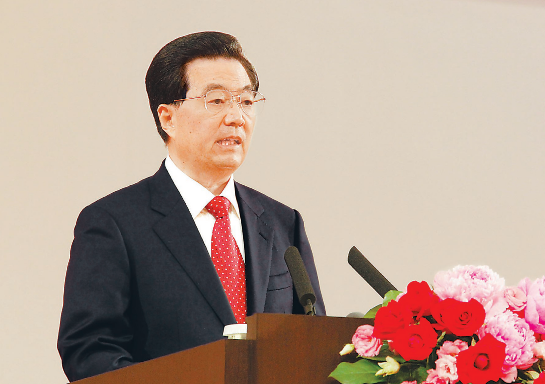
7月1日,中共中央总书记、国家主席、中央军委主席胡锦涛在庆祝香港回归祖国15周年大会暨香港特别行政区第四届政府就职典礼上发表重要讲话。

胡锦涛强调,中央政府实行 一国两制 、港人治港 、高度自治方针将毫不动摇,全力支持香港特别行政区行政长官和政府依法施政将毫不动摇,同香港各界人士一道维护和促进香港长期繁荣稳定将毫不动摇。在中央政府、香港特别行政区政府和社会各界人士共同努力下,一国两制 实践一定会越来越丰富,香港与祖国内地共同繁荣发展的道路一定会越走越宽广。