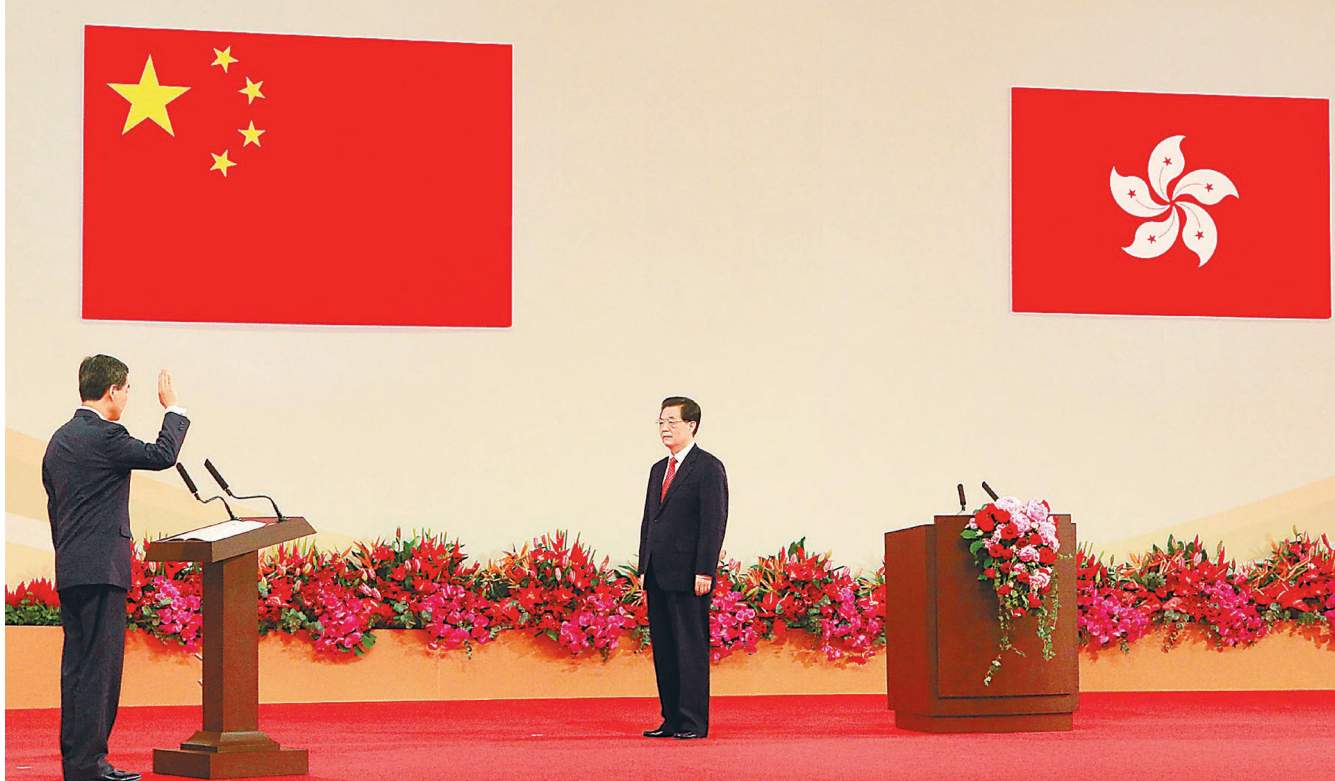
7月1日,中共中央总书记、国家主席、中央军委主席胡锦涛出席庆祝香港回归祖国15周年大会暨香港特别行政区第四届政府就职典礼。这是由胡锦涛监誓,香港特别行政区第四任行政长官梁振英宣誓就职。

新华社香港7月1日电 (记者邹声文 张勇 刘欢) 庆祝香港回归祖国15周年大会暨香港特别行政区第四届政府就职典礼1日上午在香港会展中心隆重举行,中共中央总书记、国家主席、中央军委主席胡锦涛出席并发表重要讲话。胡锦涛强调,中央政府实行 一国两制 、港人治港 、高度自治方针将毫不动摇,全力支持香港特别行政区行政长官和政府依法施政将毫不动摇,同香港各界人士一道维护和促进香港长期繁荣稳定将毫不动摇。在中央政府、香港特别行政区政府和社会各界人士共同努力下,一国两制 实践一定会越来越丰富,香港与祖国内地共同繁荣发展的道路一定会越走越宽广。 香港会展中心会场华灯齐放,百花竞艳。主席台上,中华人民共和国国旗和香港特别行政区区旗格外醒目,气氛庄重而热烈。 当胡锦涛在香港特别行政区第四任行政长官梁振英陪同下步入会场时,全场起立鼓掌。 9时许,庆祝大会暨就职典礼开始。全体起立,高唱中华人民共和国国歌。 胡锦涛走上主席台监誓。梁振英首先宣誓就职,他面对中华人民共和国国旗和香港特别行政区区旗,举起右手庄严宣誓。宣誓完毕,胡锦涛同梁振英紧紧握手。 接着,由胡锦涛监誓,在梁振英带领下,香港特别行政区第四届政府主要官员宣誓就职。宣誓完毕后,胡锦涛同他们一一握手。 随后,由梁振英监誓,香港特别行政区行政会议成员宣誓就职。 在热烈的掌声中,胡锦涛发表了重要讲话。他代表中央政府和全国各族人民,向全体香港市民致以诚挚问候,向刚刚宣誓就职的香港特别行政区第四任行政长官梁振英先生和第四届政府主要官员、行政会议成员表示热烈祝贺,向所有关心香港、为香港顺利回归并保持繁荣稳定作出贡献的海内外同胞和国际友人表示衷心感谢。 胡锦涛指出,香港回归祖国是彪炳中华民族史册的伟大业绩,也是上个世纪末具有重大国际影响的历史事件。从回归祖国那一刻起,香港就进入了新的时代、开启了新的航程。15年来的一切充分证明,一国两制 是历史遗留的香港问题的最佳解决方案,也是香港回归后保持长期繁荣稳定的最佳制度安排,推进 一国两制 事业 符合香港同胞利益和愿望,也符合国家和民族根本利益。在 一国两制 伟大实践中,香港这颗璀璨的明珠放射出更加绚丽的色彩。 胡锦涛强调, 一国两制 事业是前无古人的伟大创举,需要在实践中不断开拓前进。在已经取得成就的基础上不断探索,把 一国两制 事业继续推向前进,是中央政府、香港特别行政区政府和社会各界人士的共同使命。中央政府对香港的一系列方针政策和重大举措,根本出发点和落脚点就是维护国家主权、安全、发展利益,保持香港长期繁荣稳定。这是在香港实践 一国两制 的核心要求和基本目标。为此,