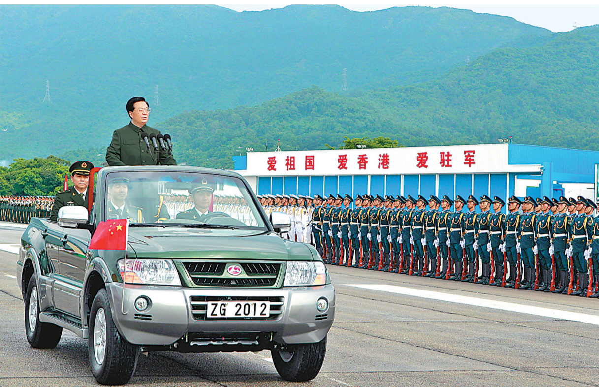
6月29日，中共中央总书记、国家主席、中央军委主席胡锦涛在香港石岗军营检阅中国人民解放军驻香港部队。

新华社香港6月29日电 (记者邹声文 车玉明 林建杨) 正在香港出席庆祝香港回归祖国15周年活动的中共中央总书记、国家主席、中央军委主席胡锦涛，29日下午视察了中国人民解放军驻香港部队，代表党中央、中央军委，向驻港部队全体官兵致以诚挚问候。