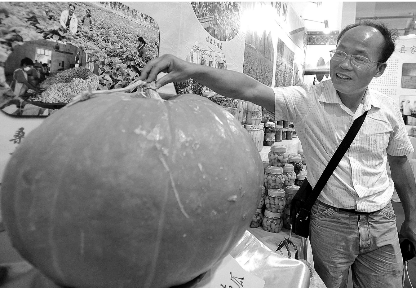
工作人员在介绍一个重达55公斤的南瓜。当日,第二届广西名特优农产品交易会在玉林市开幕,本届交易会以“生态绿色美广西,加工特色好产品”为主题,全国上千家企业到会参展。

山东即墨市金口镇的稻田绿意盎然,水稻长势喜人。大批白鹭纷纷来此栖息觅食,田园充满诗情画意。