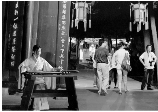
6月10日至10月7日,2012夜游武侯祠活动将在成都武侯祠举行。图为游客夜游武侯祠。