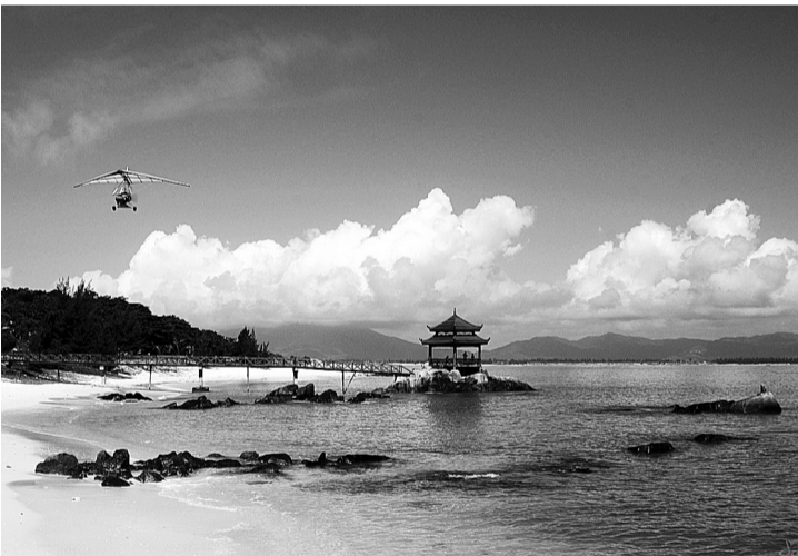
海南水清沙白,空气清新,海水、阳光、森林,十分适宜发展医疗旅游。

等相关行业要相互协调,做到医疗和旅游的有机结合、无缝链接,才能使患者享受高品质的旅游医疗服务。