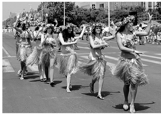
青岛市城阳第十一届市民节日前拉开帷幕。图为夏威夷草裙舞表演团在开幕式巡游上表演。