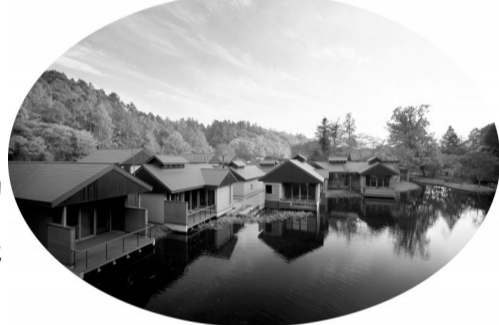
博鳌乐城内的酒店,环境优美,为医疗旅游者提供优质住宿环境。