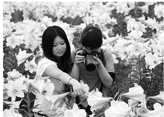
江西省永丰县藤田镇中山村以盛产龙芽百合而闻名。图为游客来到千亩百合花基地游玩。

本报讯 记者文晶报道:汉宜高铁将于7月初正式通车。届时,合肥游客可坐动车去欣赏三峡美景。高铁开通首日,安徽中铁国旅将预定500张高铁票来满足广大游客需求。同时,安徽中铁国旅还制订了详尽的行程计划,将推出三峡人家、三峡大坝动车二日游 三峡大瀑布、大三峡全景、白布城动车三日游 神农架、三峡大坝、三峡大瀑布动车往返三日游 等多条主打线路,在交通、住宿、门票、餐饮、导游等方面也做了周到的计划安排,尽力为游客创造独特的旅途体验。